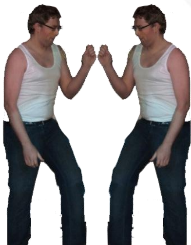
Age ontkent bestaan scheidsrechtersboks